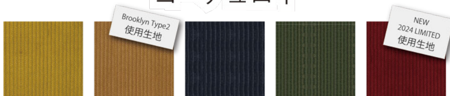
C キャメル C ブラウン C ネイビー C カーキ C ワイレッド