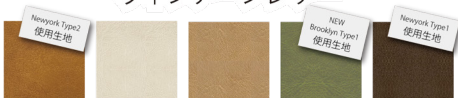
BA01 BA02 BA03 BA05 BA06