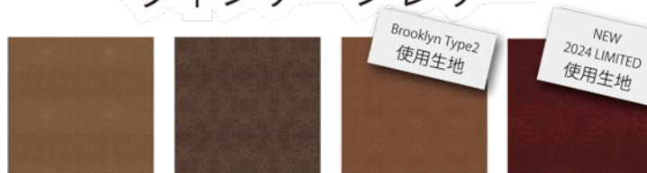
VL 5415 VL 5417 VL 5421 VL 5423