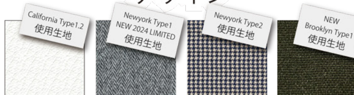
L #01 Harris Tweed Light Gray HerringBone Harris Tweed Blue x Navy x White 千鳥格子 アルバートン カーキドラブ